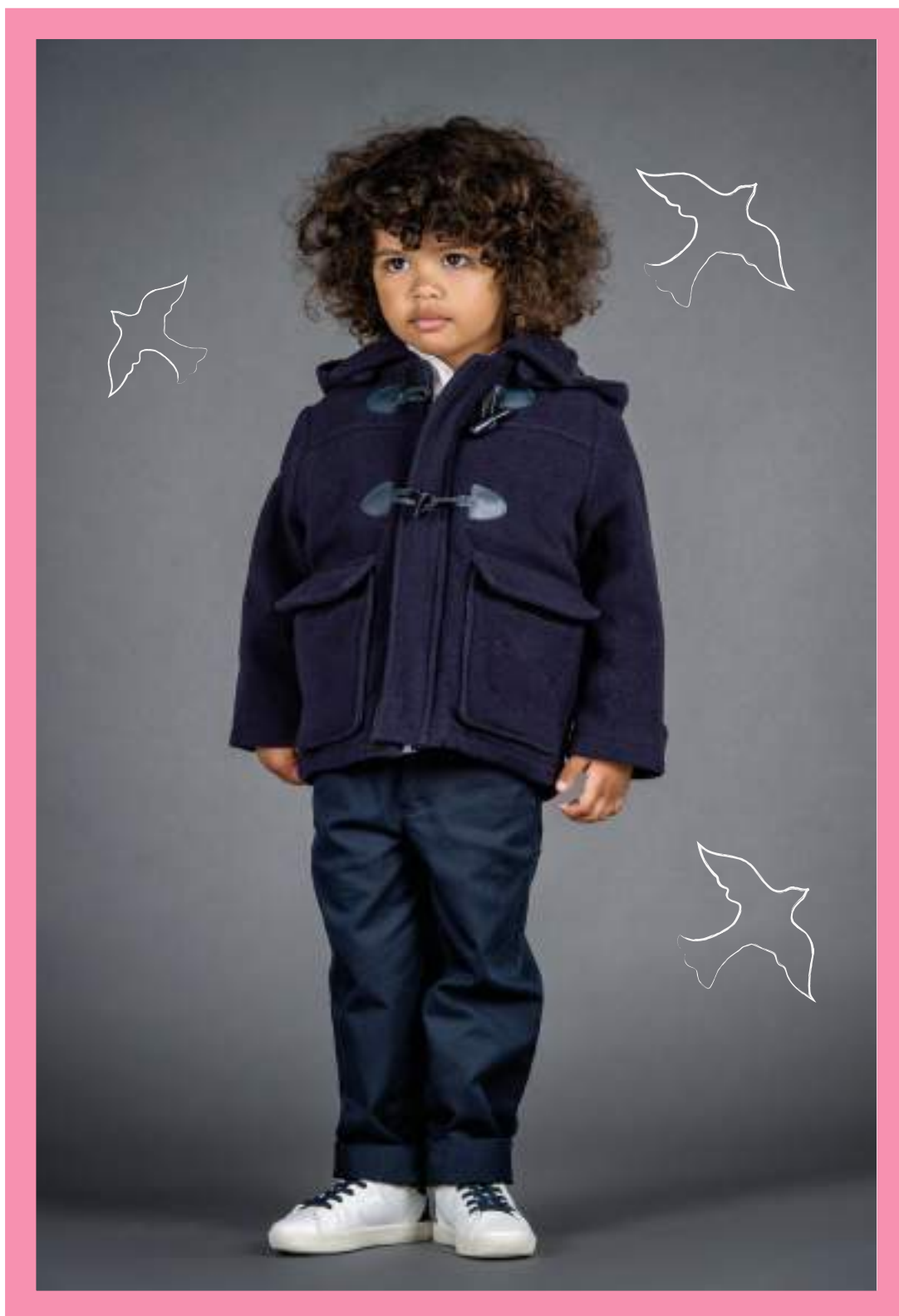
Canadiana Capuz/Jacket Ref. 1201710(042) Calças Vaqueiro/Pants Ref. 0500510(009)