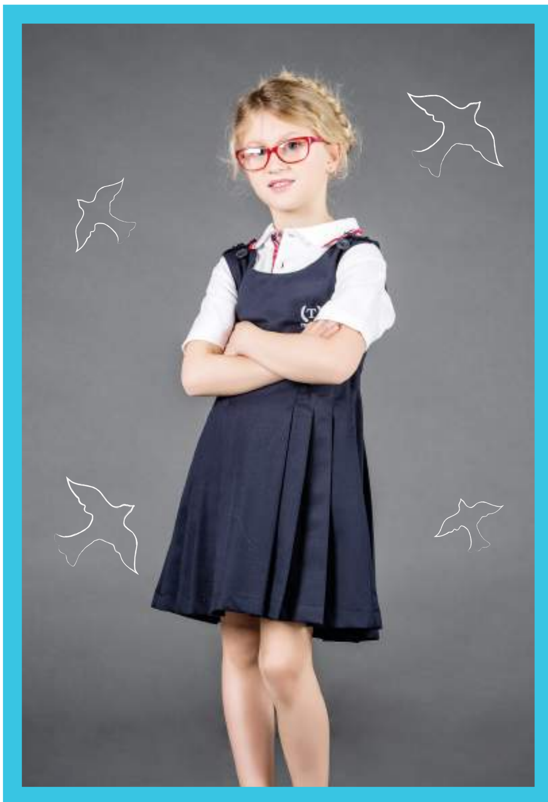
Polo/Shirt Ref. 1300111(034) Vestido/Dress Ref. 1501210(009)