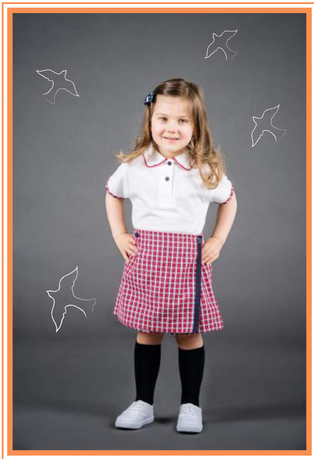
Polo Menina/Shirt Ref. 1305300(034) Saia Calção/Skirt-Shorts Ref. 1500310(022)