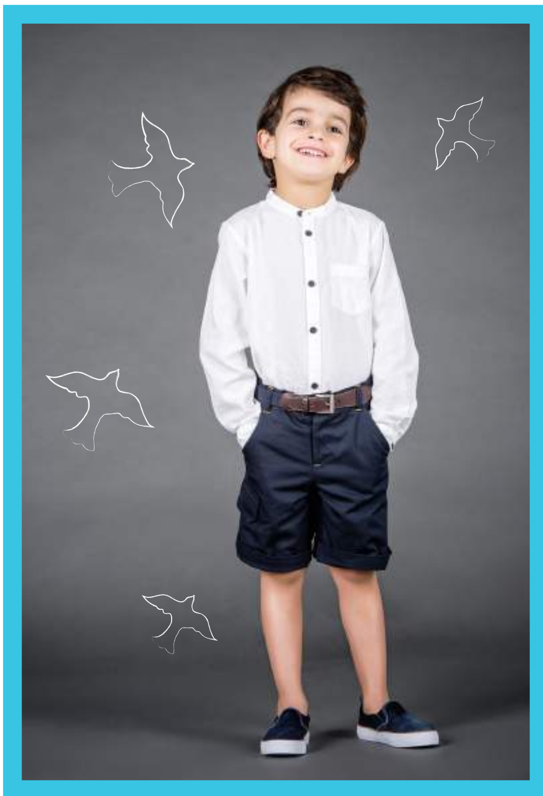
Camisa de Gola Mao/Shirt Ref. 0707200(005) Calção/Shorts Ref. 0601910(009)