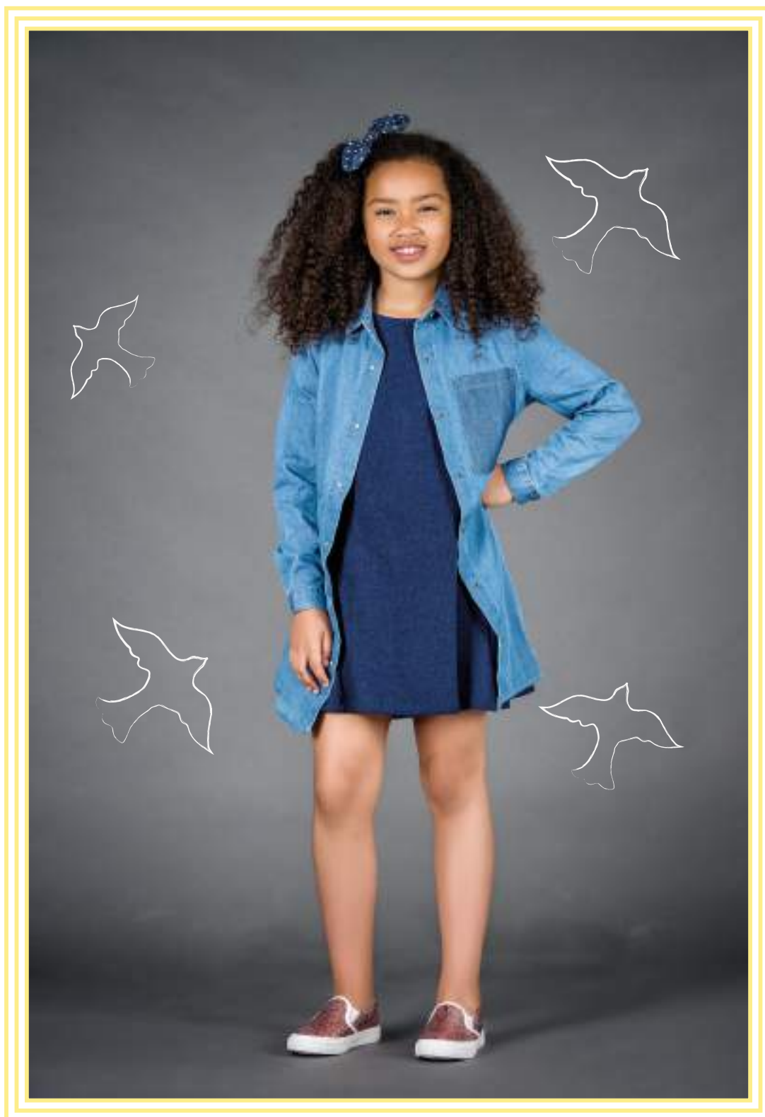
Vestido de Malha/Dress Ref. 1802700(031) Camisa em Denim/Shirt Ref. 1802800(017)