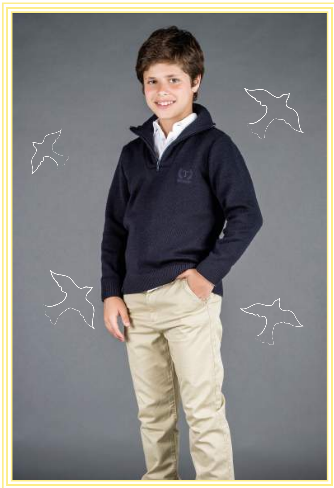
Pullover de Fecho Ref. 3000500(053) Calças/Pants Ref. 0518100(009)