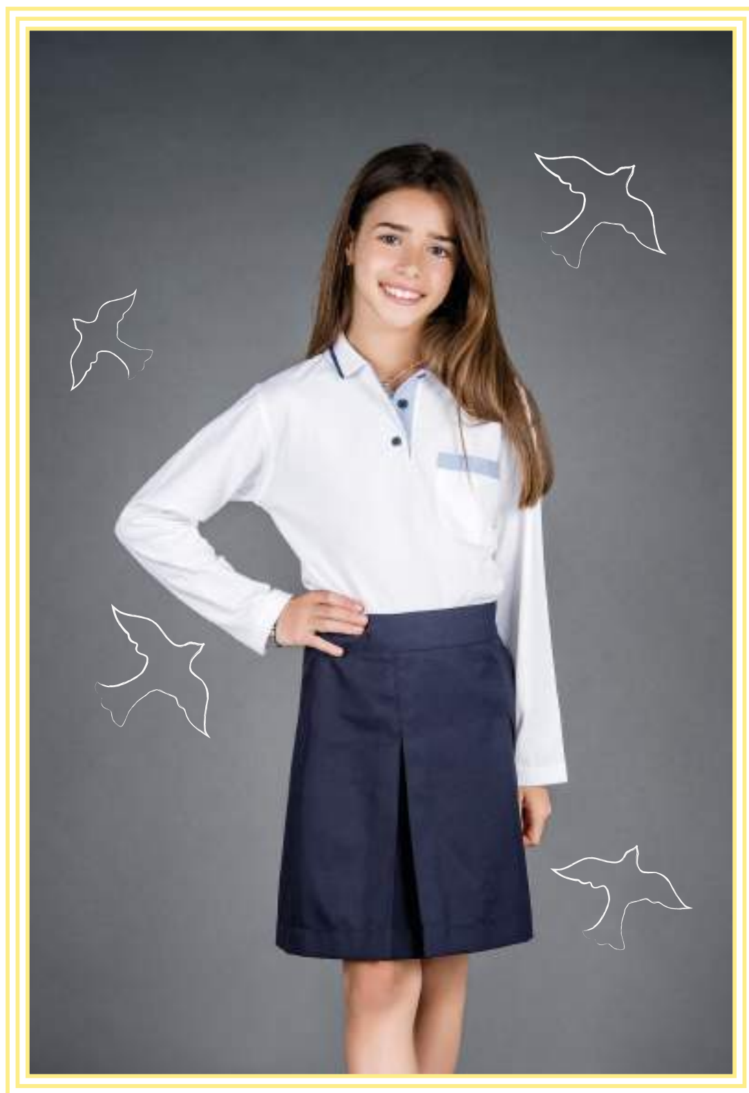
Polo de Manga/Shirt Ref. 1312200(034) Saia/Skirt Ref. 1500810(009)