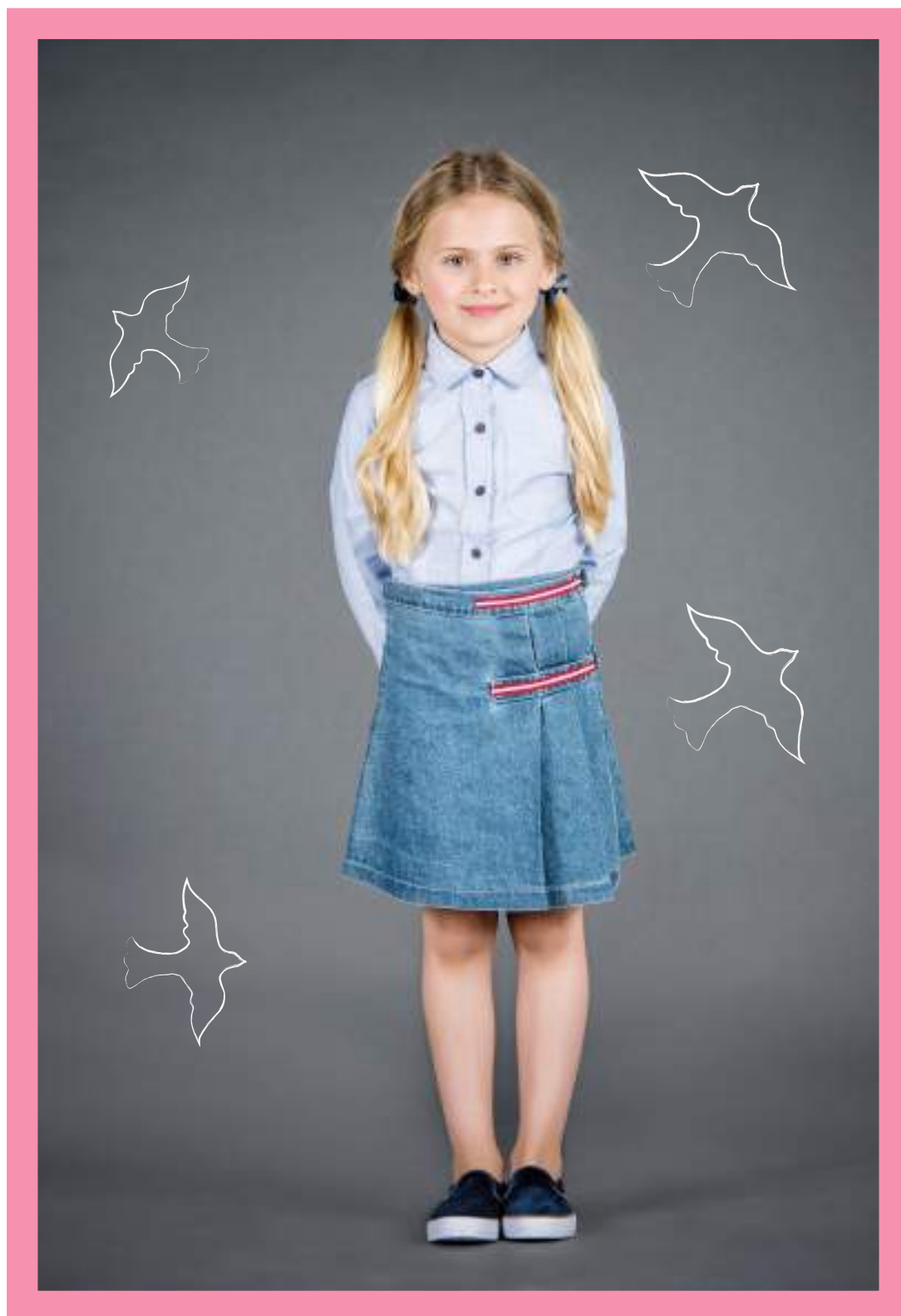
Blusa com Bolso/Blouse Ref. 0302500(002) Saia Trespasse/Skirt Ref. 1502301(017)