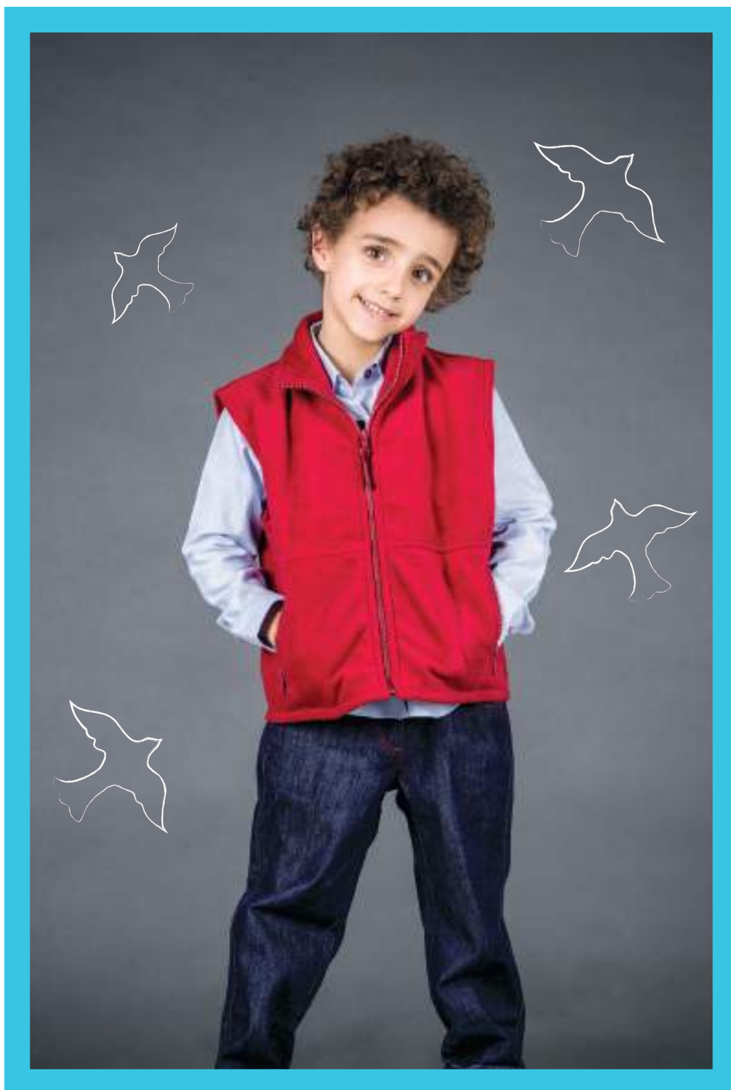
Colete Polar/Vest Ref. 1003500(042) Calças Denim/Jeans Ref. 0503011(018)