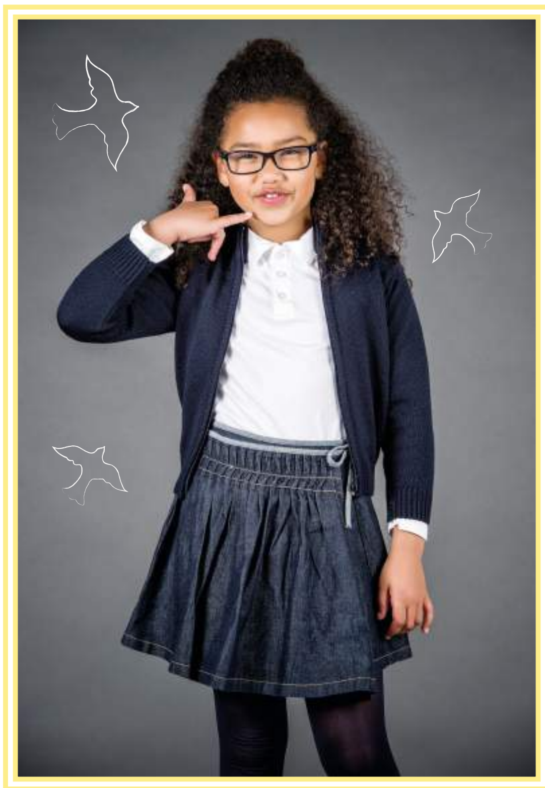
Casaco Tricotado/Jacket Ref. 3000100(053) Polo/Shirt Ref. 1312000(034) Saia Denim/Skirt Ref. 1505700(017)