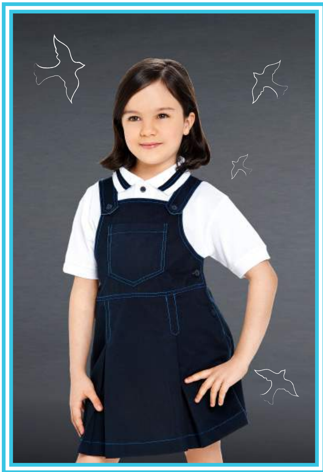
Polo/Shirt Ref. 1305400(034) Saia de Peito/Dress Ref. 1500110(022)