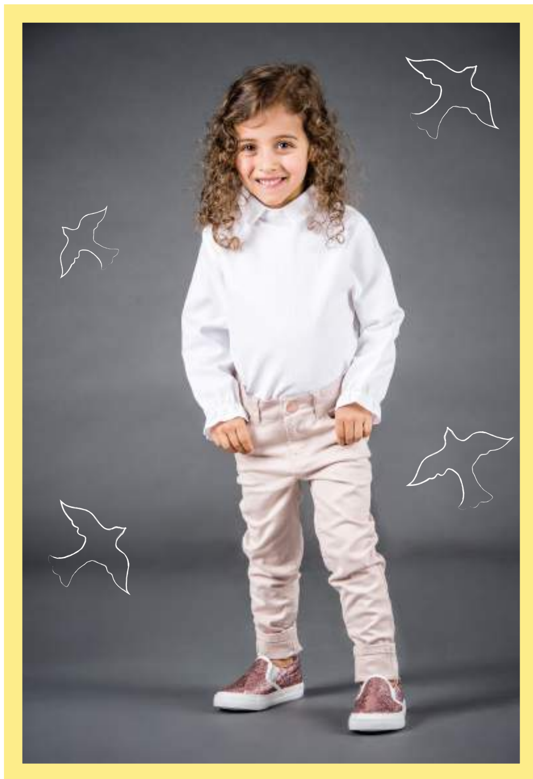
Blusa de punho franzido/Blouse Ref. 0310000(022) Calças/Pants Ref. 0518000(008)