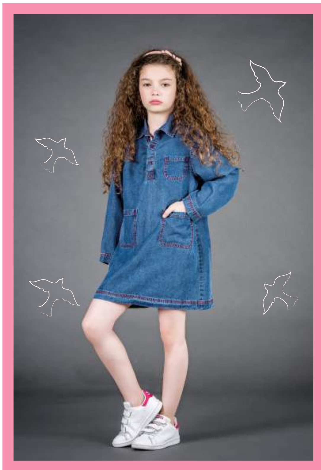
Vestido Denim/Dress Ref. 0208900(017)