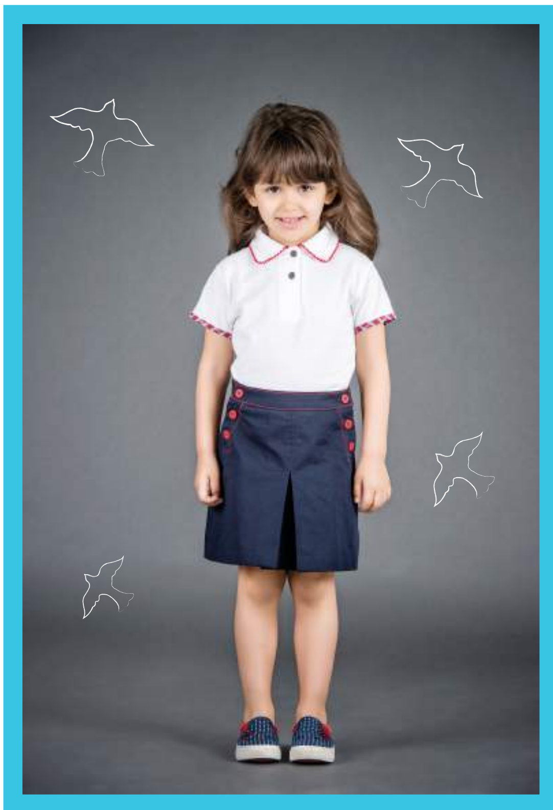
Polo Menina/Shirt Ref. 1305300(034) Saia/Skirt Ref. 1501600(009)