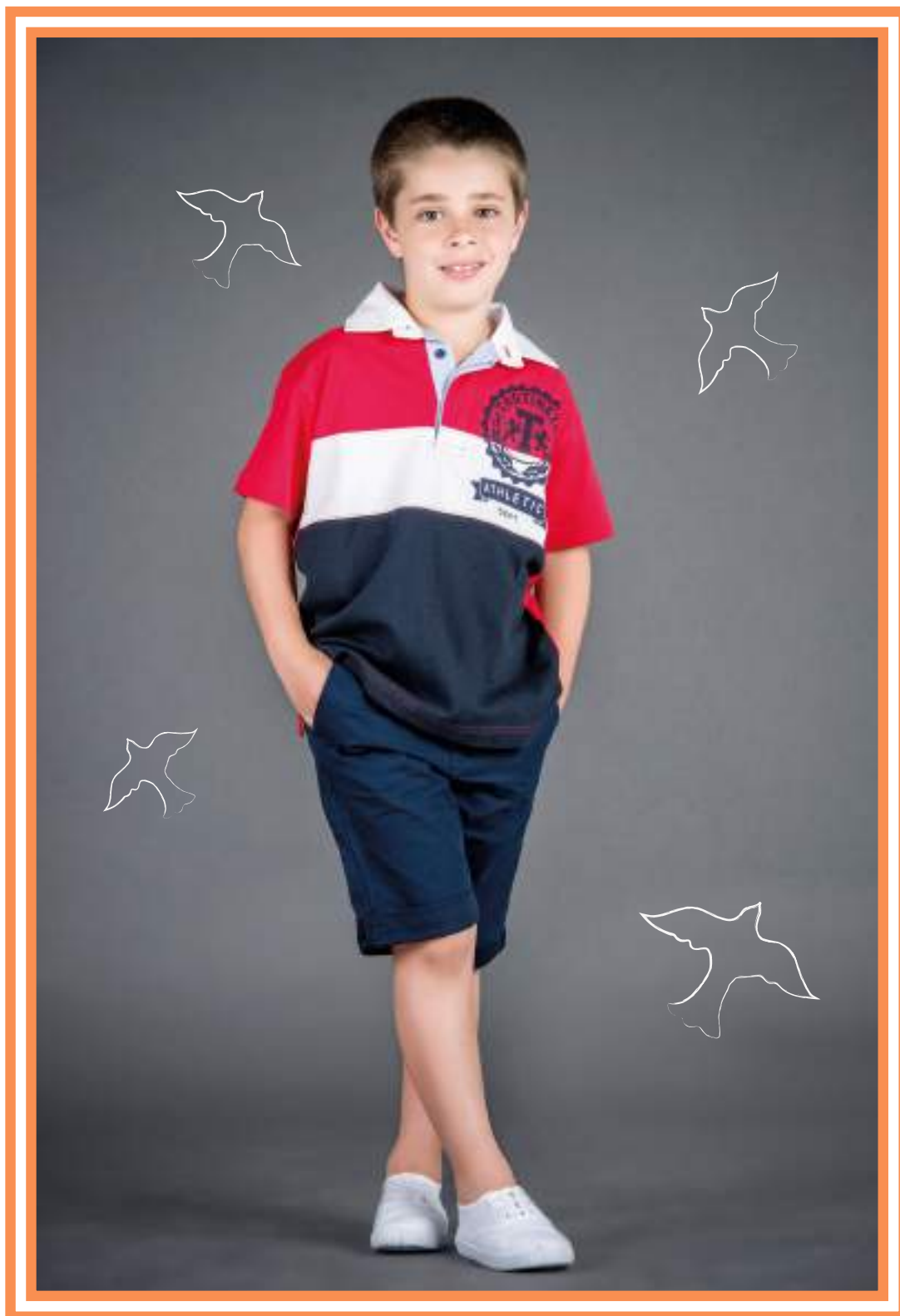
Polo Tricolor/Shirt Ref. 1304640(039) Calção Clássico/Shorts Ref. 0600210(008)