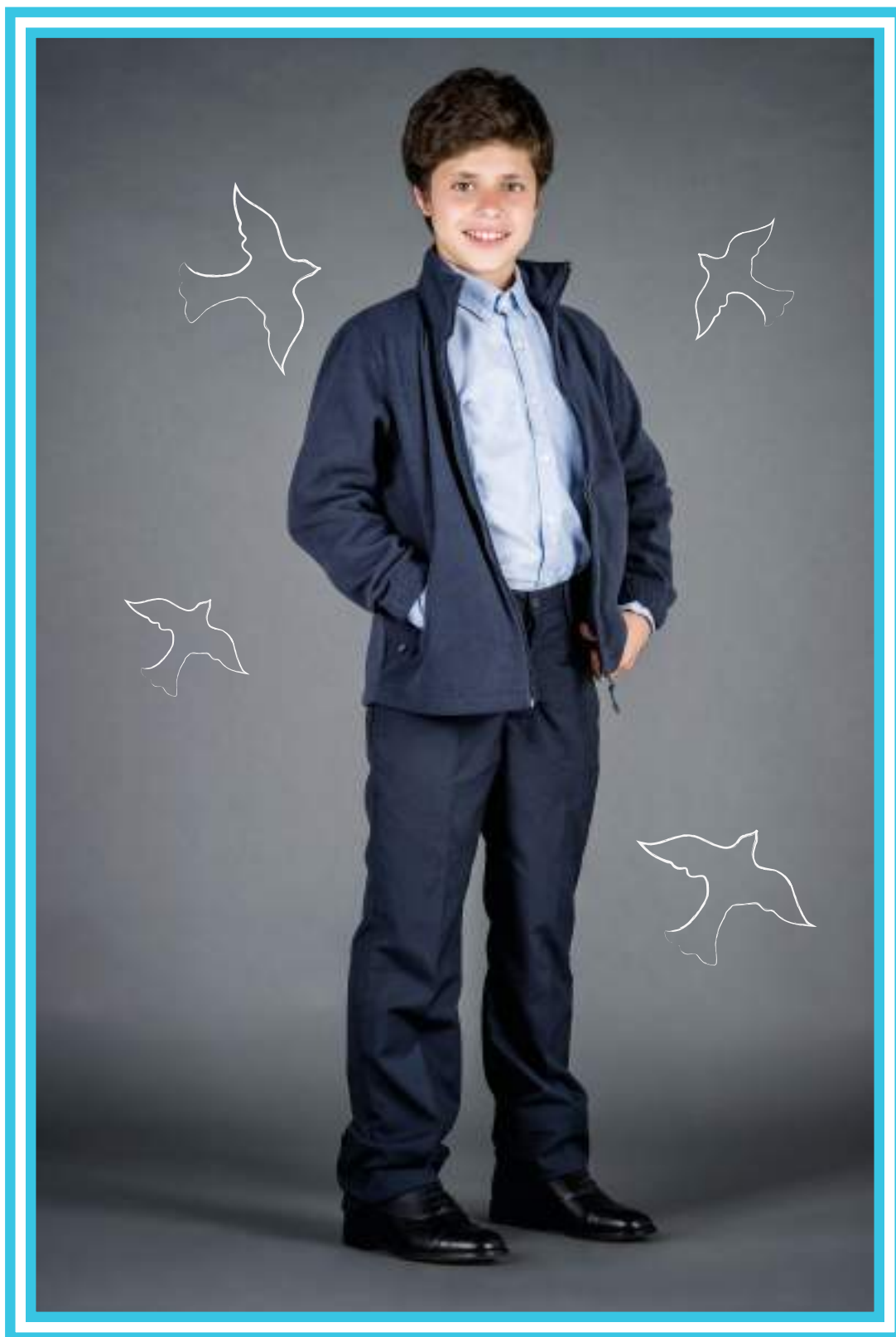
Casaco Polar de Fecho/Jacket Ref. 0907900(042) Calças Clássicas/Pants Ref. 0517401(011)