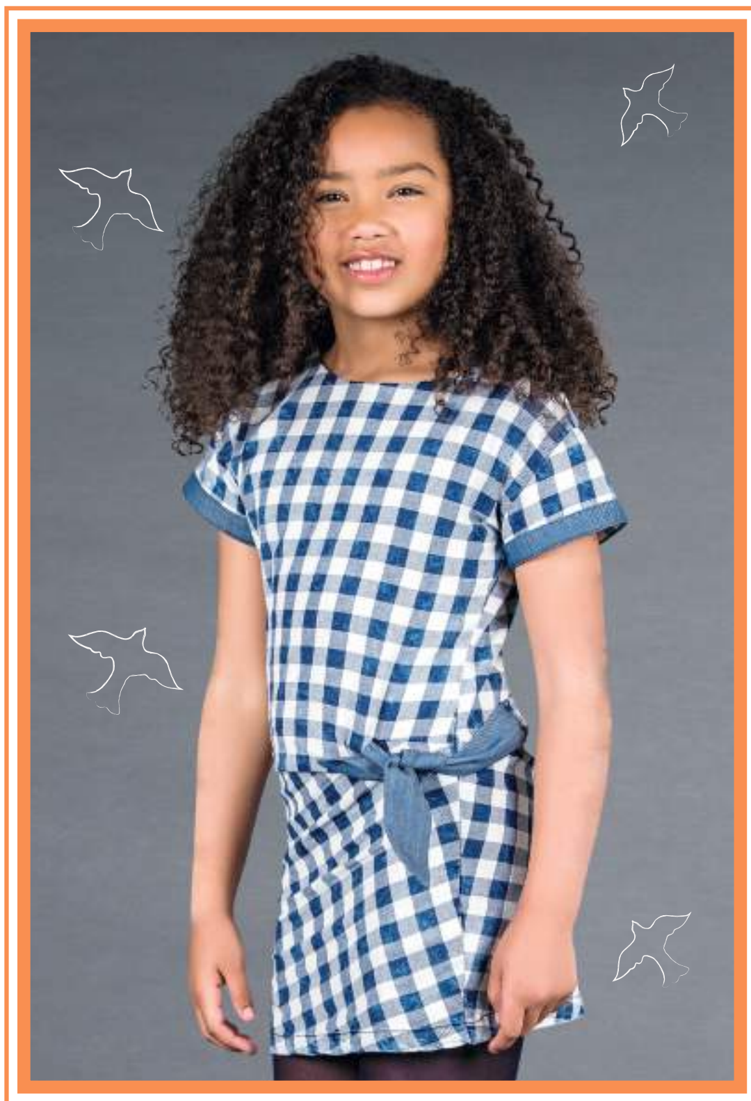
Vestido/Dress REF. 1802600(022)