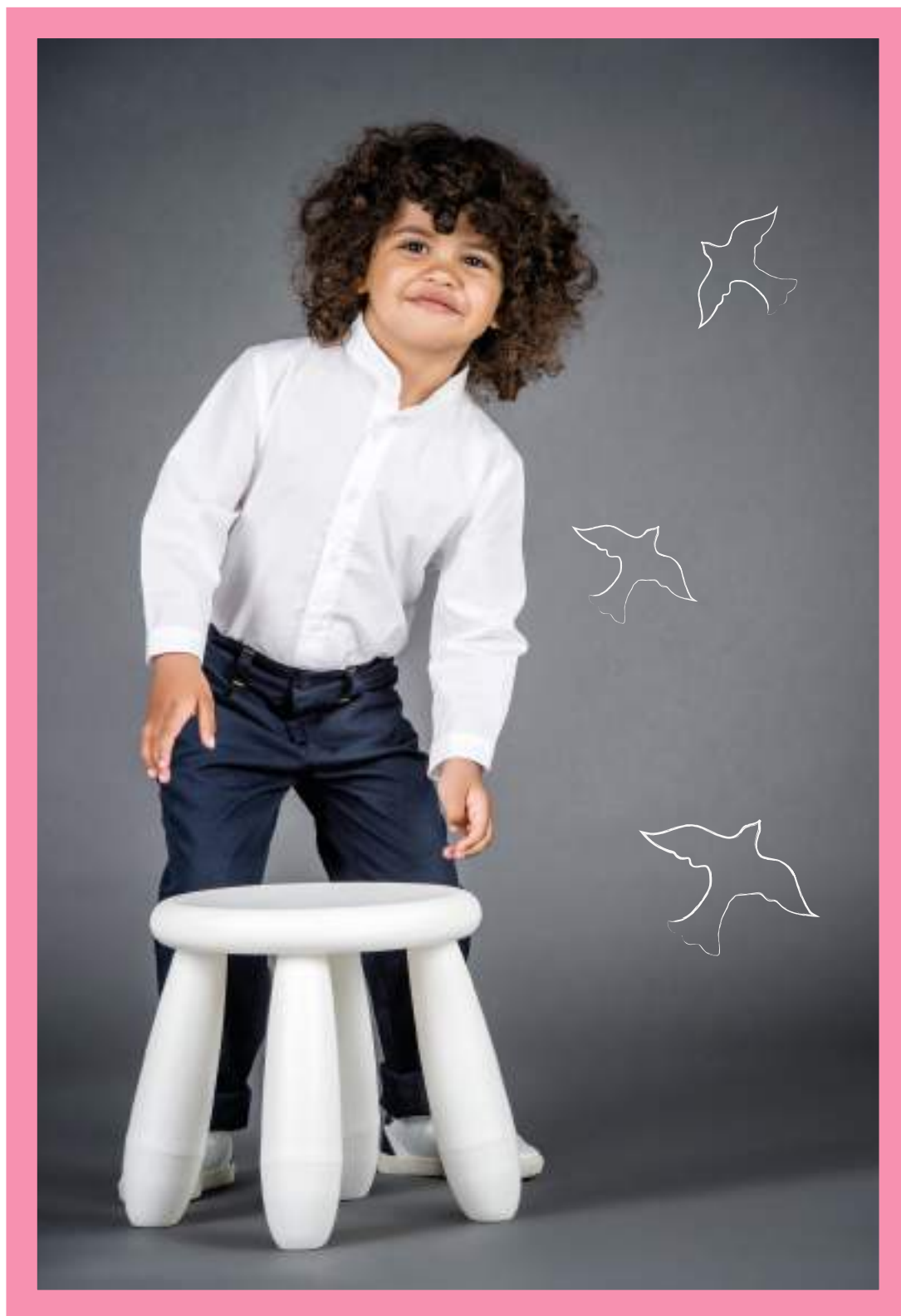
Camisa Gola Mao/Shirt Ref. 0706300(000) Calças Vaqueiro/Pants Ref. 0500510(009)