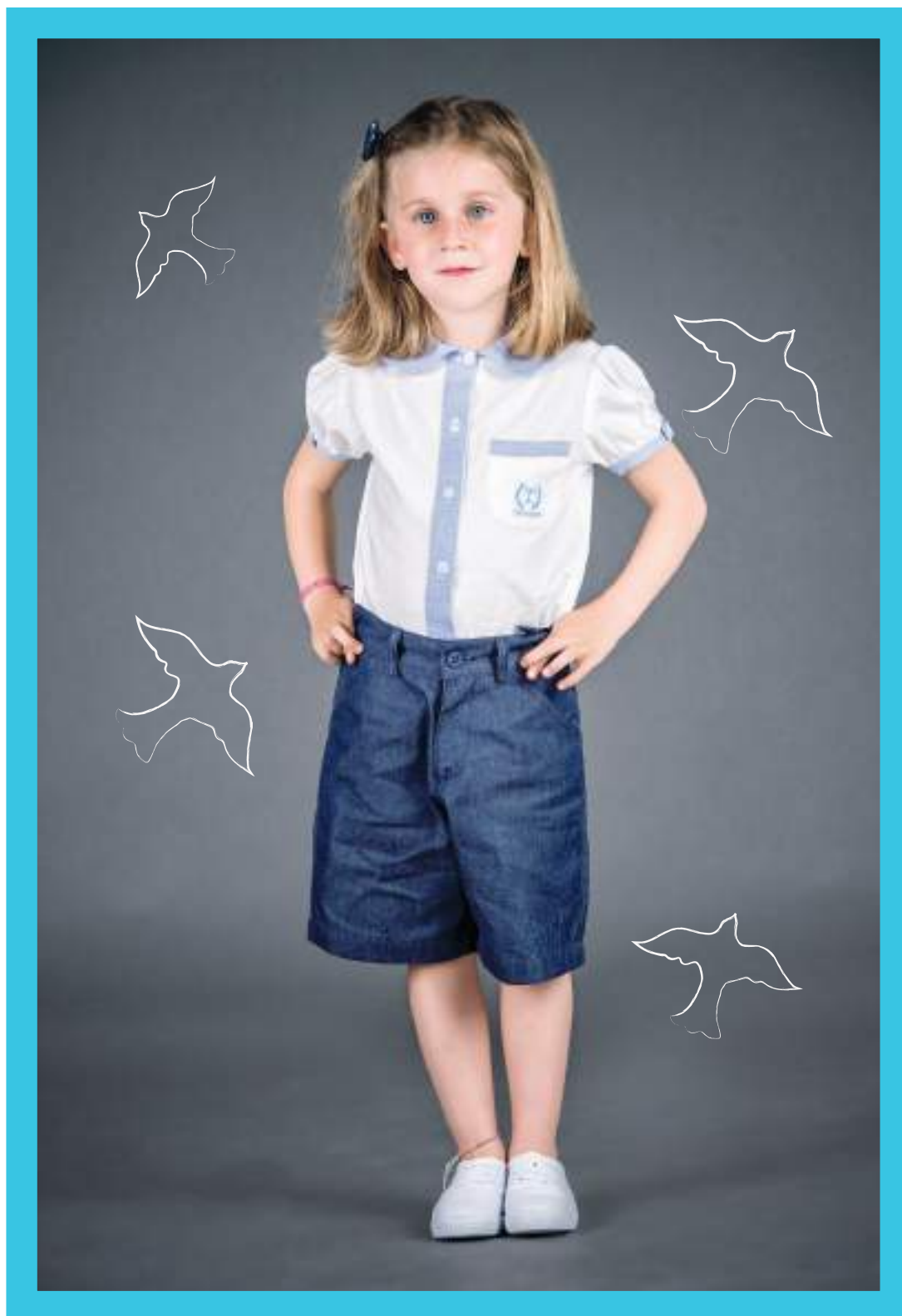
Blusa Manga Balão/Blouse Ref. 0302310(002) Calção Denim/Shorts Ref. 0601510(017)