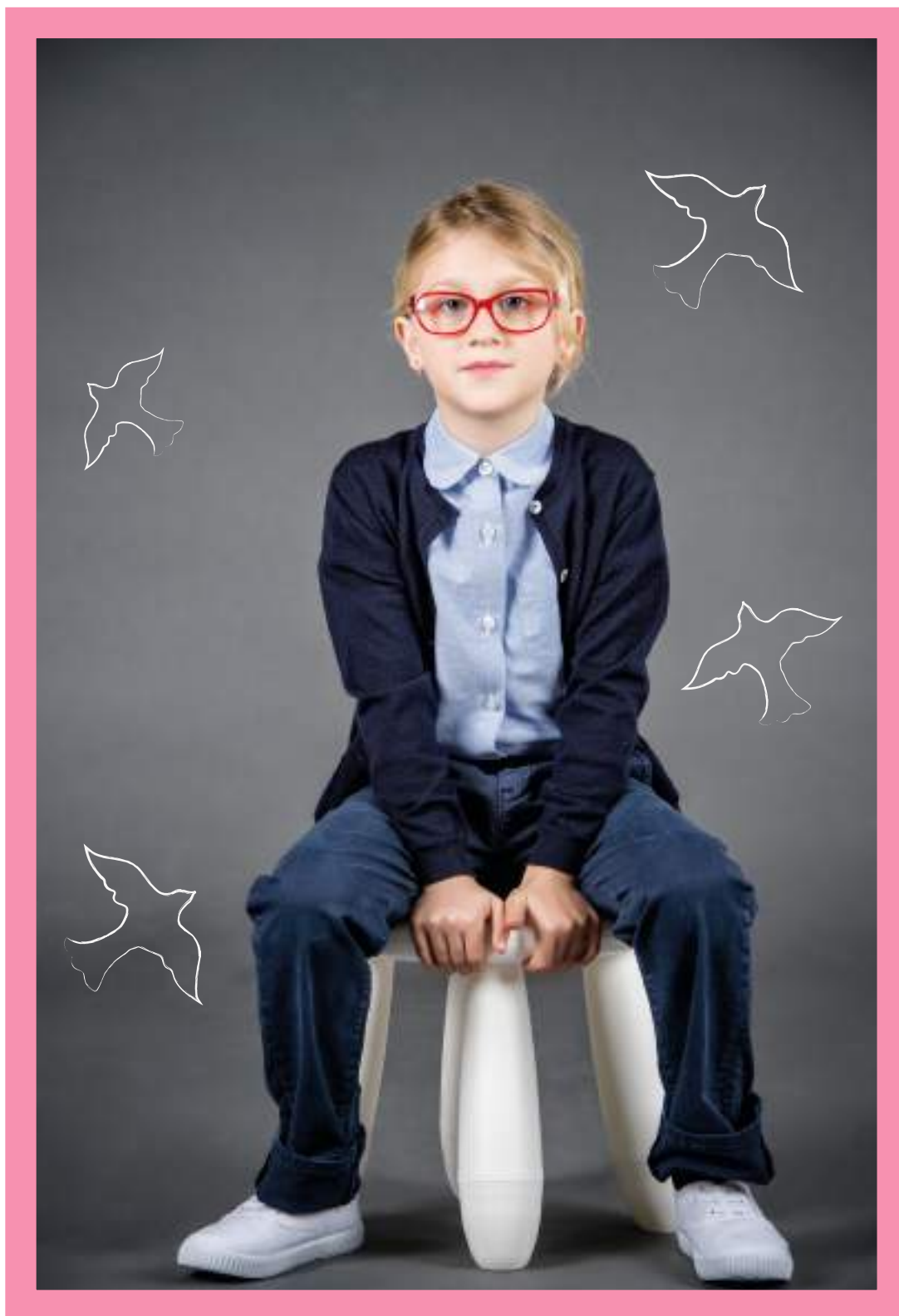
Casaco Tricotado/Jacket Ref. 3010700(053) Blusa com Gola Redonda/Blouse Ref. 0303100(002) Calças Vaqueiro/Pants Ref. 0501810(009)