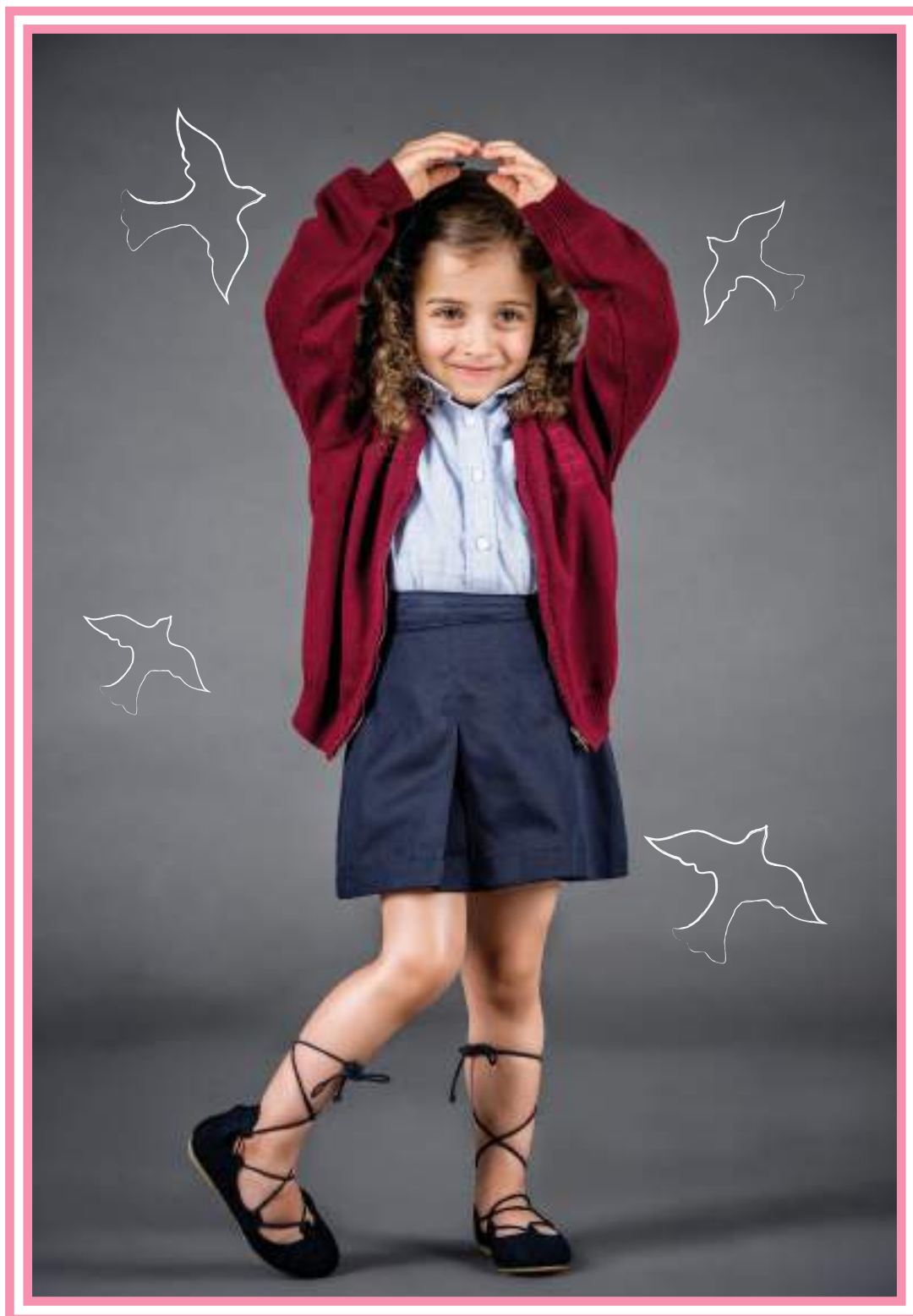
Casaco Tricotado/Jacket Ref. 3006500(044) Blusa com Bolso/Blouse Ref. 0309400(002) Saia/Skirt Ref. 1500810(009)