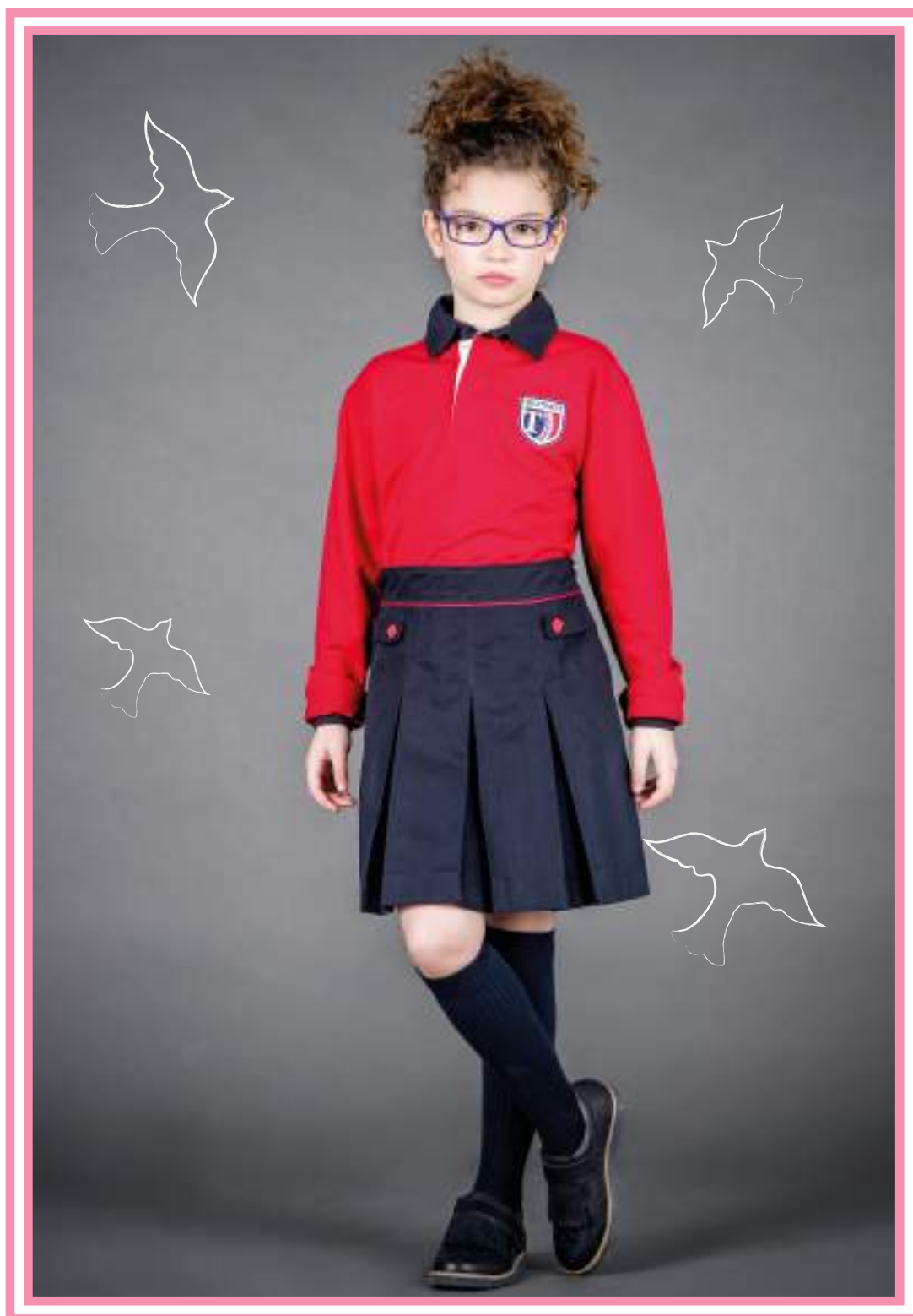
Polo Manga Comprida/Shirt Ref. 1305220(039) Saia de Machos/Skirt Ref. 1505610(009)