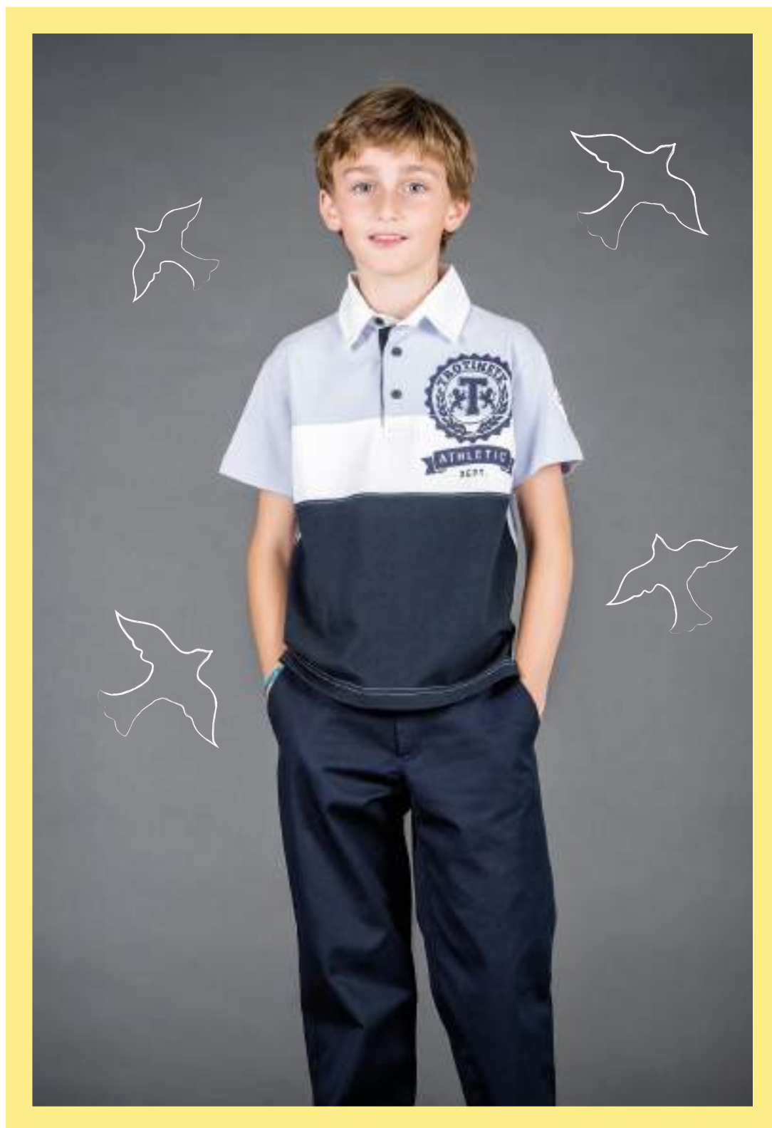
Polo Tricolor/Shirt Ref. 1304640(034) Calças Vaqueiro/Pants Ref. 0500510(009)